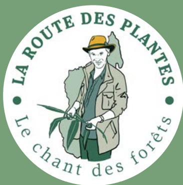
Réserve de Vohimana

Retrouvez ces trois portraits des lieux illustrés par Robinson ici :