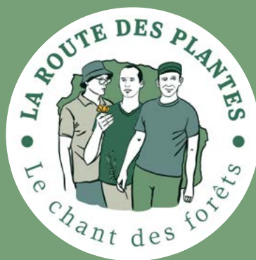
La Forêt de Nuages