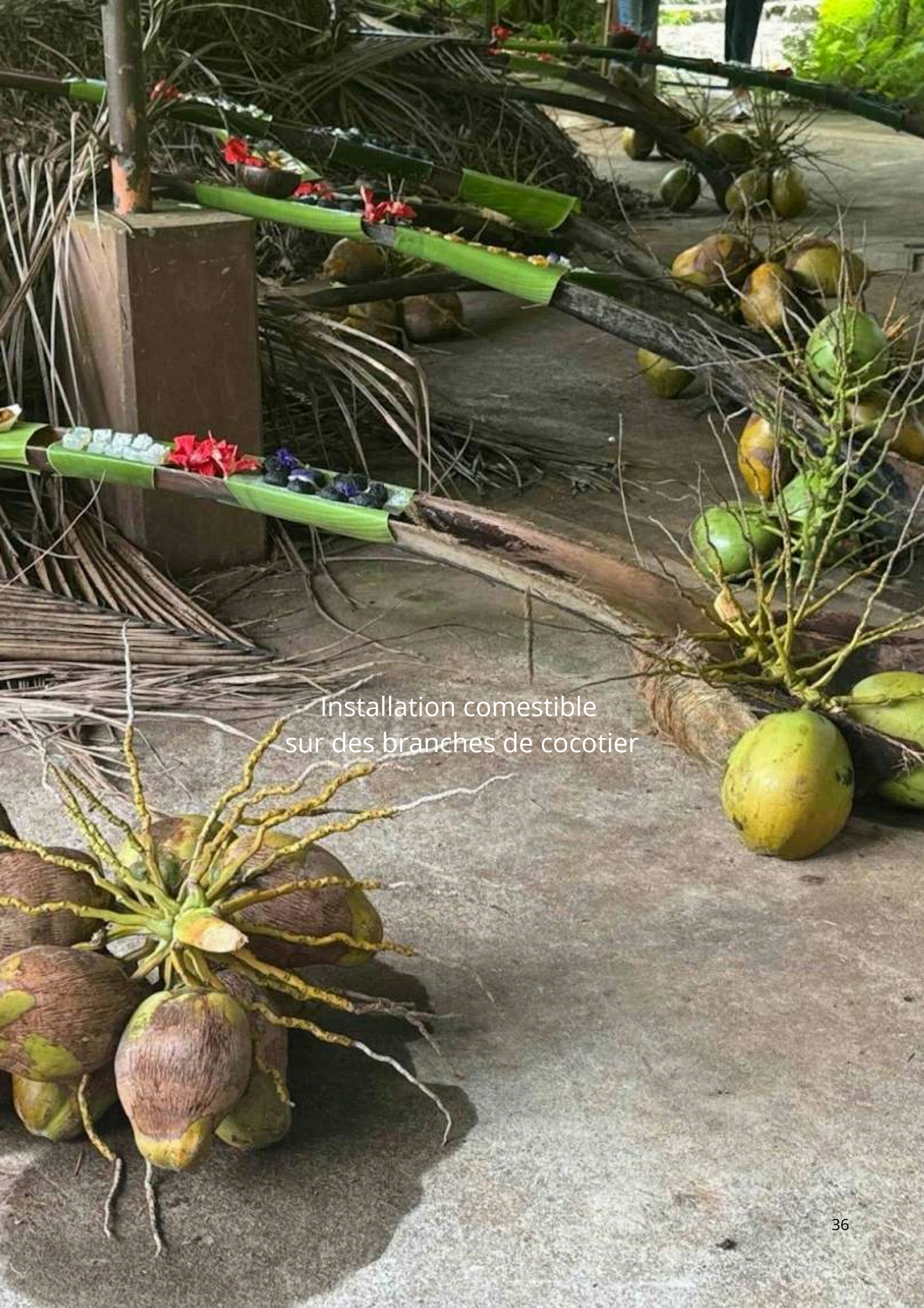
Installation comestible sur des branches de cocotier