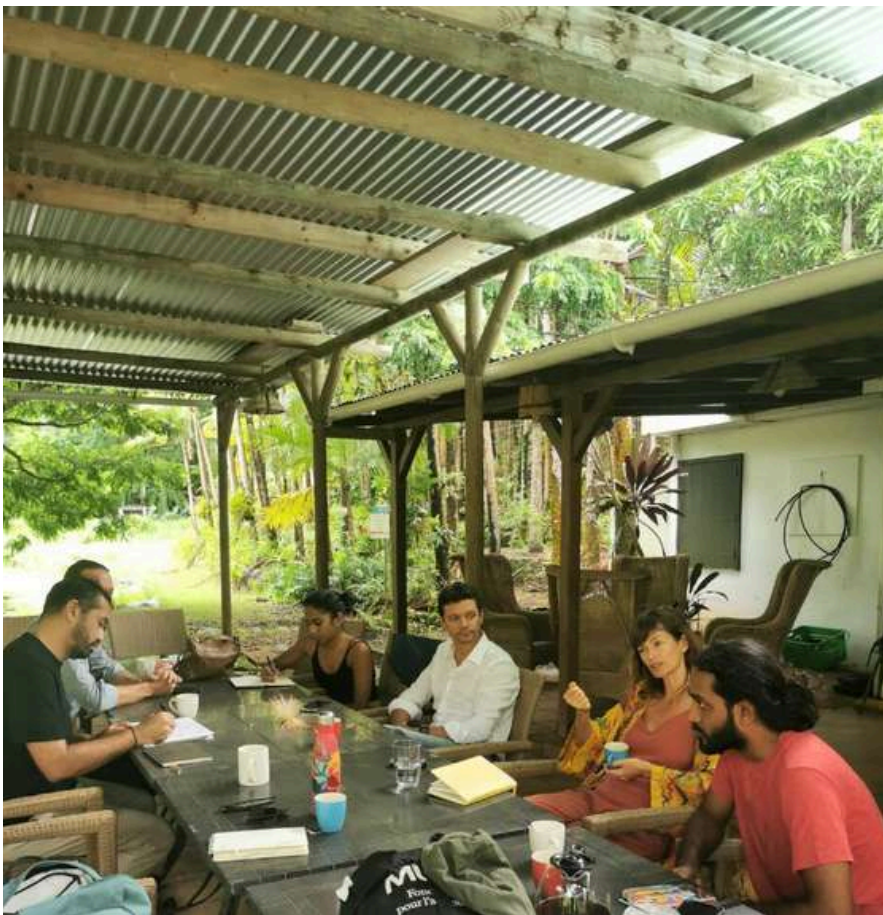
Première réunion en présentielle entre l'équipe de La Route des Plantes, le Chant des Forêts, Move for art et Terres d'Agroécologie à Chamouny pour discuter des besoins du site et de l'alignement avec la résidence de recherche

Une telle recherche croisée permet de penser autrement les enjeux de l'agroécologie, cette discipline étant encore "rare" et peu connue dans le paysage local mauricien. Les fermes ont plusieurs enjeux, notamment pour certaines de devenir tiers lieu sur le long terme. Plusieurs questions se sont posées : Comment transmettre les pratiques de l'agroécologie sans les intellectualiser ? Il nous semblait qu'un retour à la curiosité instinctive pour une intégration complète sollicitant tous les sens permettrait de se familiariser avec la discipline.