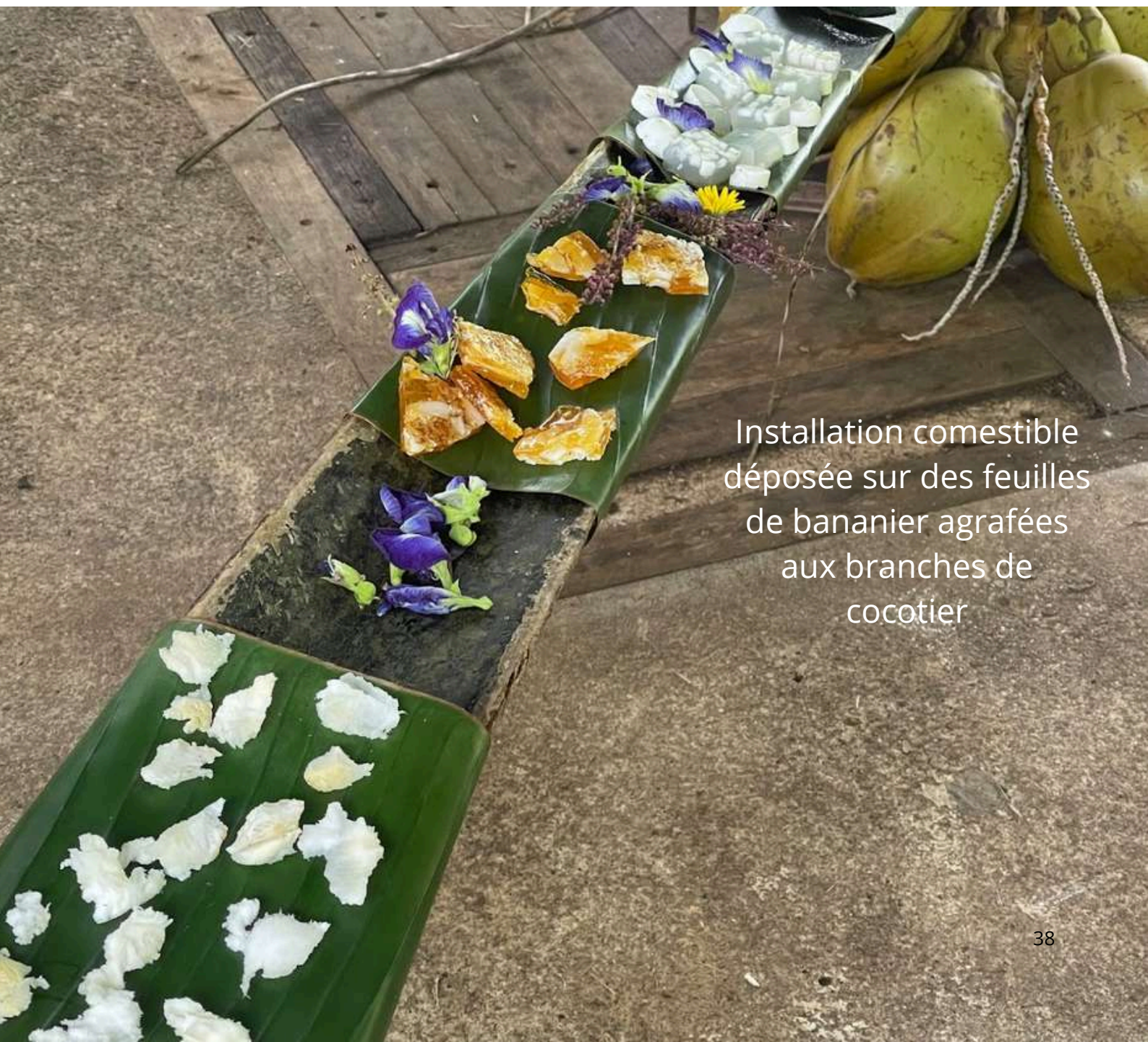
Installation comestible déposée sur des feuilles de bananier agrafées aux branches de cocotier

Le rassemblement a été intentionnellement simple, sans facilitation ni présentation formelle, permettant aux échanges et aux connexions de se déployer de manière organique. CocoStar a occupé un espace intermédiaire entre recherche et hospitalité, art et agriculture, production et soin. Ses limites résident dans sa fragilité et sa temporalité. Le repas n'a existé qu'un instant et dépendait de la confiance, de la disponibilité et de l'effort partagé. En même temps, ces qualités constituent son potentiel. Le prototype reste adaptable et réactivable, capable de prendre place dans d'autres contextes avec d'autres matériaux et communautés, tout en conservant son intention première : utiliser le partage de nourriture comme forme de présence collective.